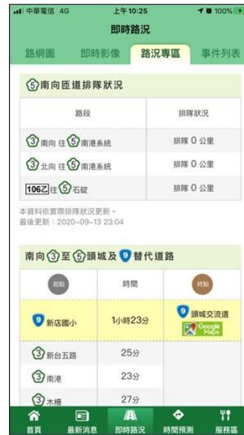
南向匝道排隊狀況 國3及106以往國5排隊km