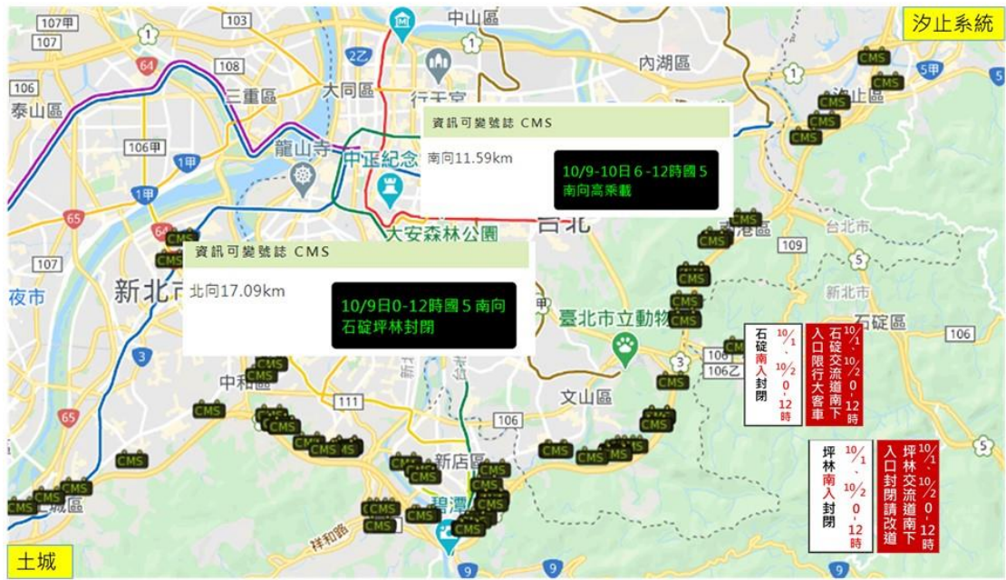
宣導國5疏導措施CMS及匝道封閉標誌圖