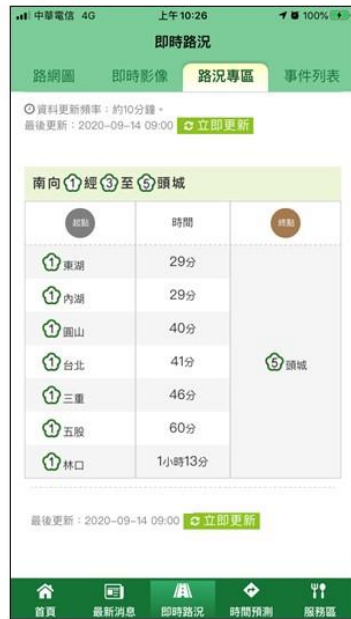
南向國1經國3至國5時間 國1林口以北旅行時間