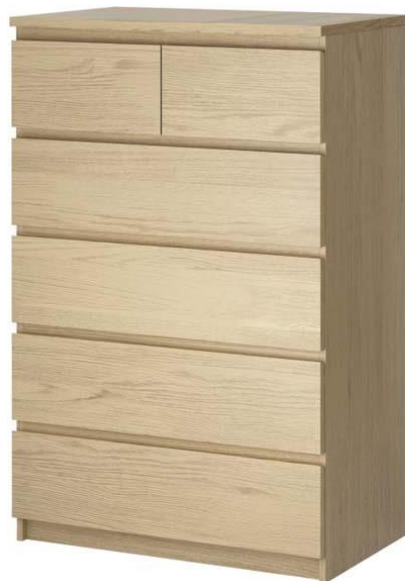
Malm(馬爾姆) 6 抽抽屜櫃