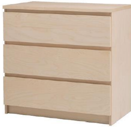
Malm(馬爾姆) 3 抽抽屜櫃