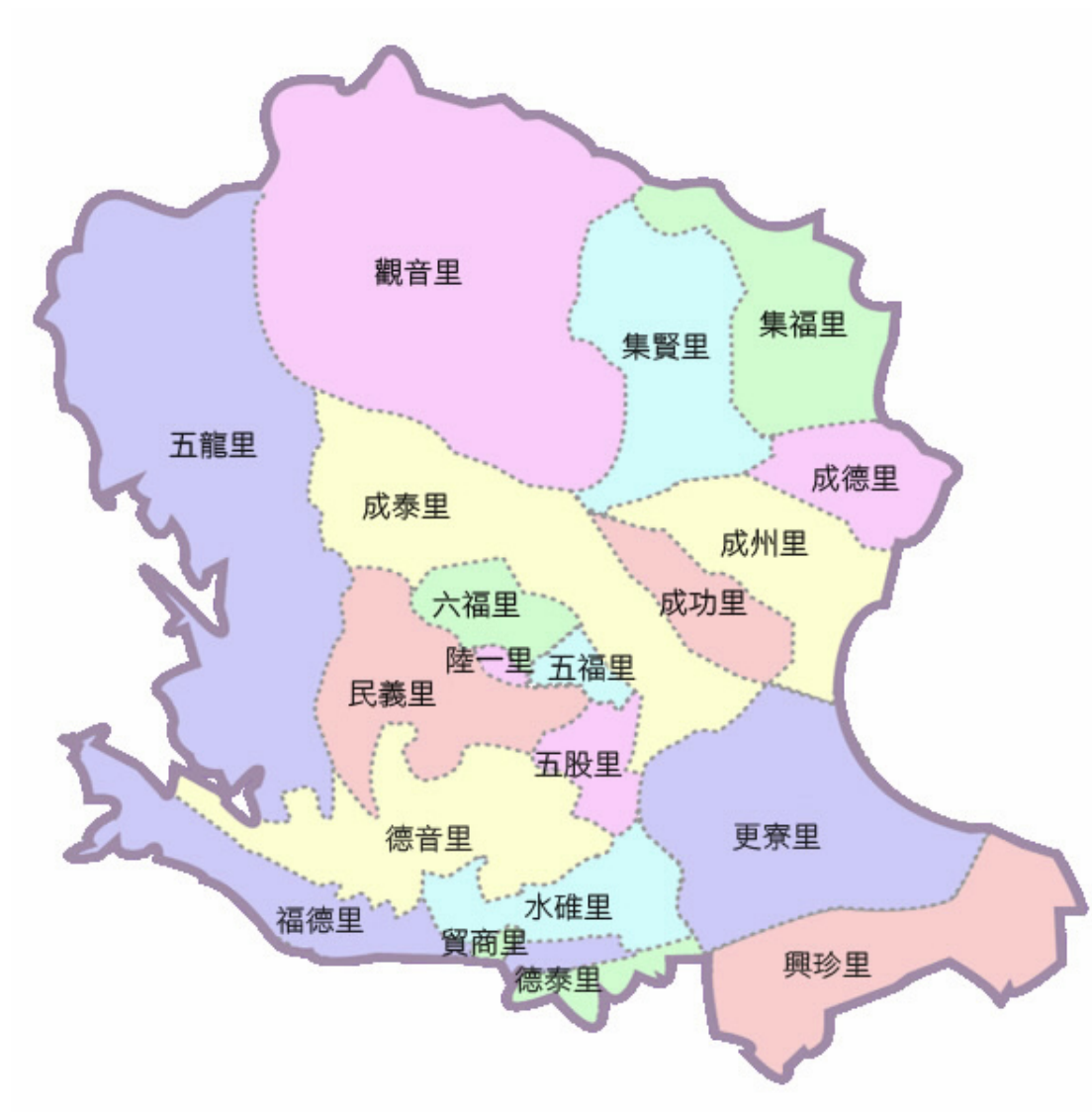
圖 1-1 新北市五股區行政區域圖