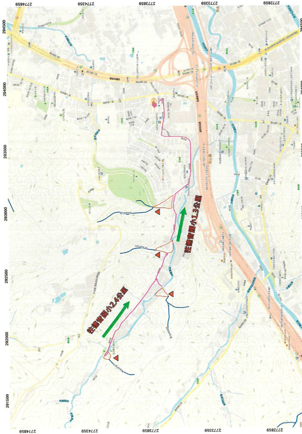
新北市五股區福德里 土石流及大規模崩塌疏散避難圖1