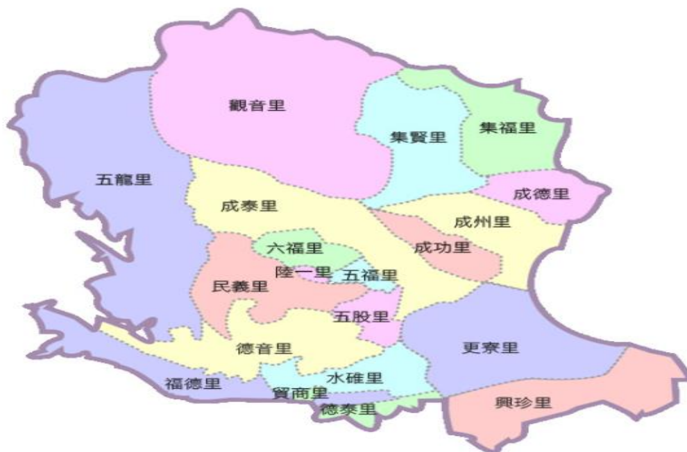
圖一 新北市五股區行政區域圖

五股區目前已登記公私有土地面積共 3,383.1582 公頃，已登記土地共 2 萬 6,698 筆；區內共有 29 里及 515 鄰，涵蓋面積 34.86 平方公里。