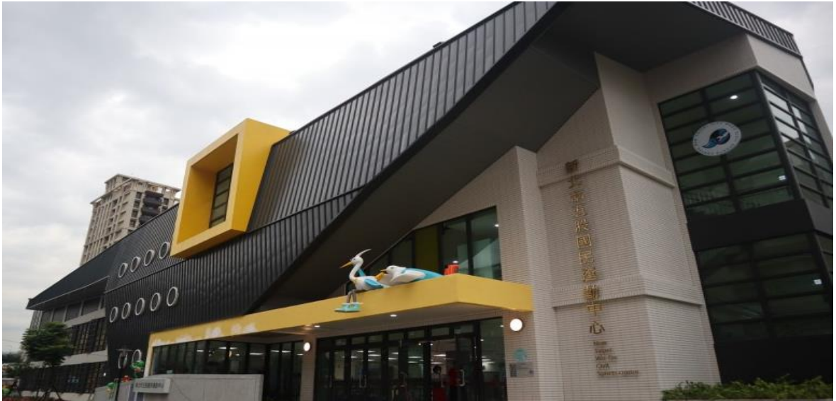
圖四 五股運動中心

五股運動中心，創作出「城市森林動起來」雙開繪本，動物與人類因運動相遇創造溫馨故事，更將平面創作立體化，帶民眾走入繽紛的動物森林運動會，不僅提供市民運動休閒空間，更讓場館成為新北市的亮眼新地標。