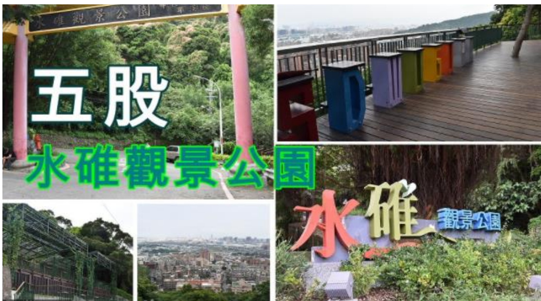
圖二 五股水碓景觀公園

水碓觀景公園，位於本區南境水碓里內，全區為十層階梯架構，水碓觀景公園居高臨下，視野景觀極佳，可俯瞰臺北盆地景致，以提供區民及外來遊客更舒適的休閒旅遊環境。